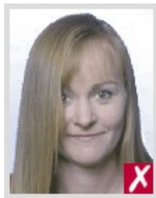
Волосы закрывают глаза