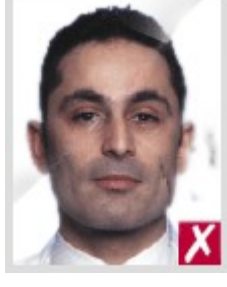
С чернильными или жирными пятнами