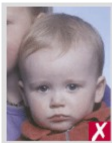
Более одного человека на фотографии