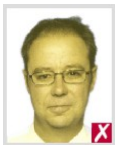
Неестественный тон кожи