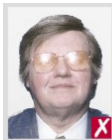
Отражения вспышки на линзах