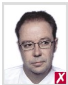
С отвернутой в сторону головой

Фотография должна быть четкой и светлой, без жирных и чернильных пятен.