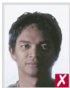
Тень падает на лицо