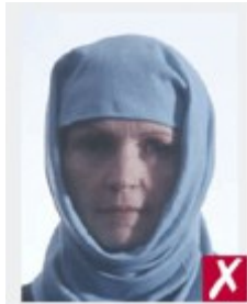
Тень падает на лицо