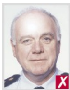
Видно отражение вспышки

Фотография должна быть сделана на светлом фоне.