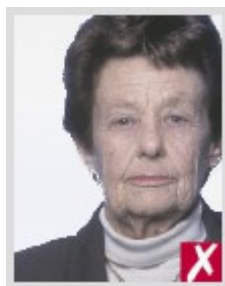
Не по центру