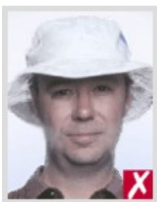
В головном уборе