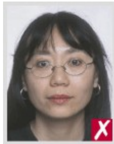
Оправка закрывает глаза