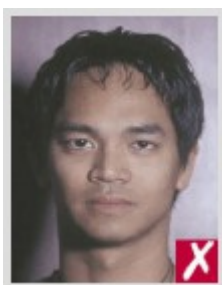
Тень на фоне