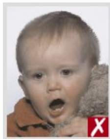
Приоткрытый рот; игрушка слишком близко к лицу