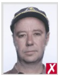
В головном уборе