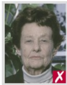
Фон не однотонный

На фотографии лицо должно быть направлено прямо в камеру, а не через плечо (портретный стиль) или с наклоненной головой. Обе стороны Вашего лица должны быть четко видны.